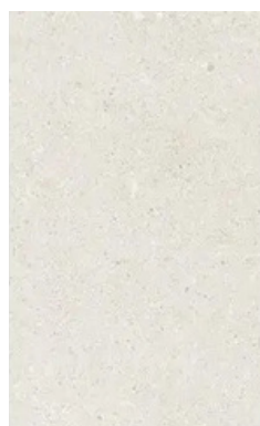
MATIKA BONE (33,3 X 100 mm)

En las terrazas exteriores de las viviendas y en las zonas comunes se colocará un pavimento, peldañado y rodapié de la marca PORCELANIA antideslizante modelo TECHSTONE MINK 100x100 mm.