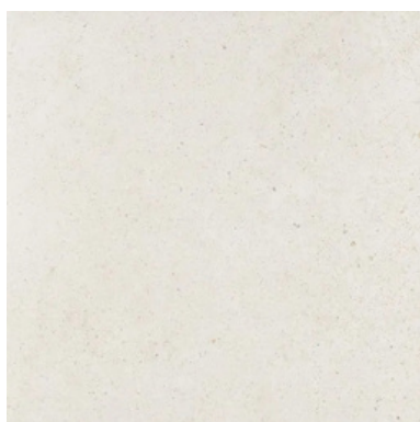
MATIKA BONE (100 X 100 mm)