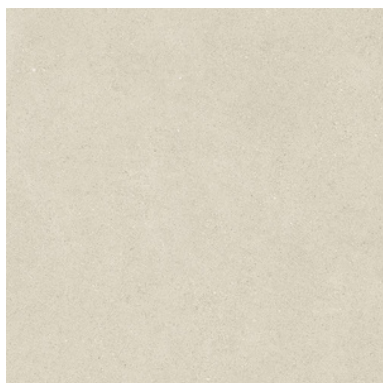
TCHSTONE MINK (100 X 100 mm)

En las terrazas exteriores de las viviendas y en las zonas comunes se colocará un pavimento, peldañado y rodapié de la marca PORCELANIA antideslizante modelo TECHSTONE MINK 100x100 mm.